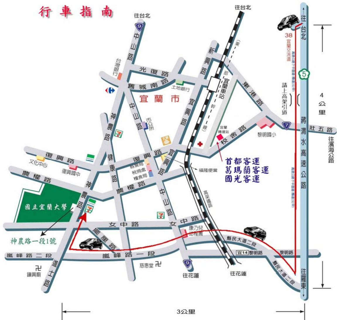
宜蘭大學交通路線圖