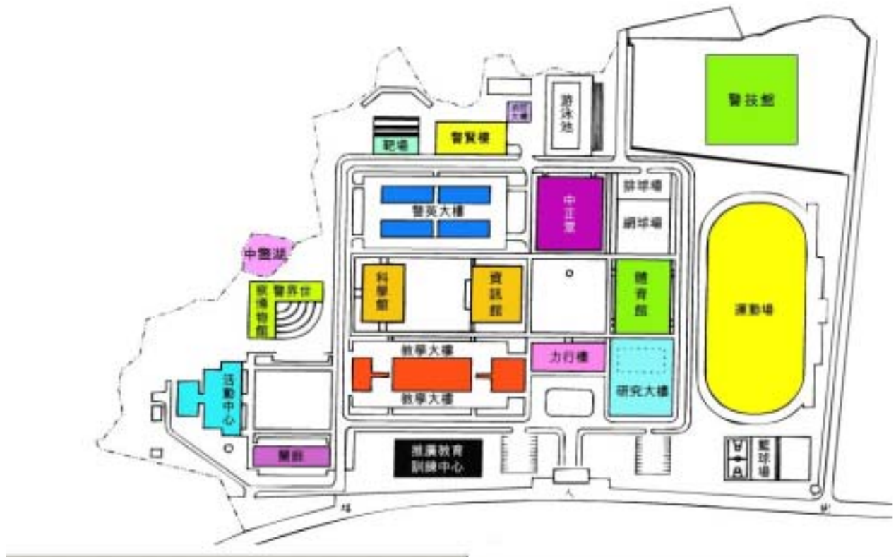
中央警察大學校區平面圖