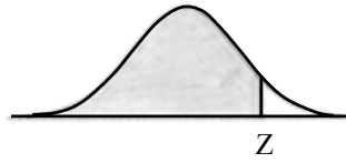
附表：標準常態分布表